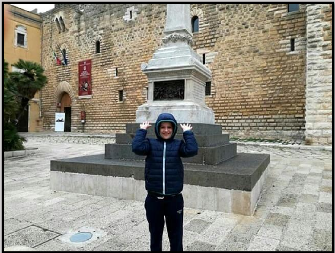
Giandomenico Antonicelli_1^F - Monumento ai Martiri del Rogo 1901 - Piazza dei Martiri dal 1799 -