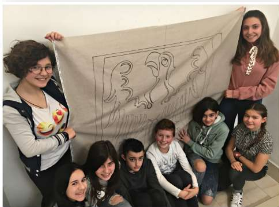
- Disegno su Stoffa -