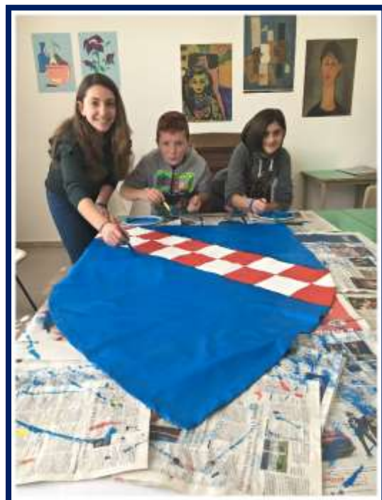
- Fasi - Pittura su Stoffa -