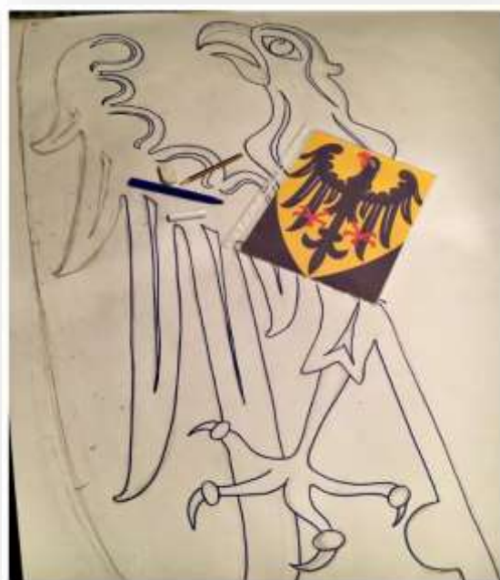
- Disegno su Carta da Imballo -