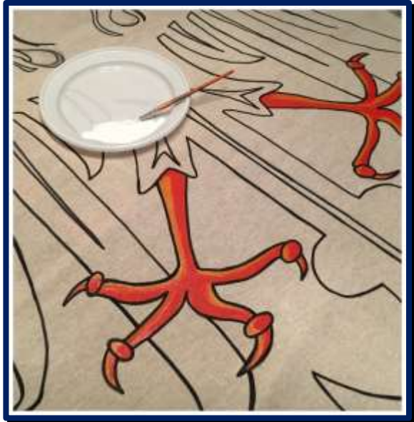
- Prime fasi di Pittura su Stoffa -