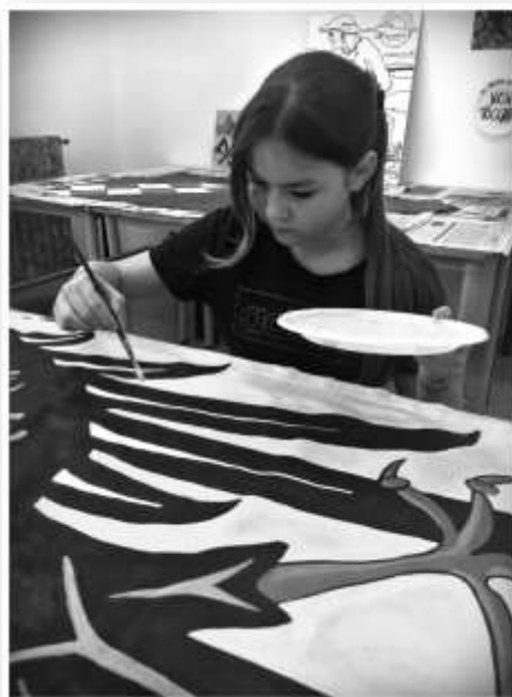
- Fasi - Pittura su Stoffa -