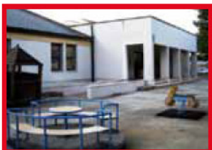
PLESSO ALDO MORO