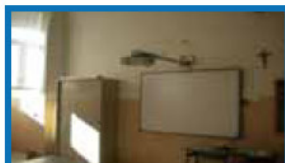
LAVAGNE INTERATTIVE MULTIMEDIALI