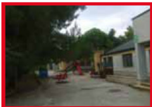
PLESSO ALDO MORO