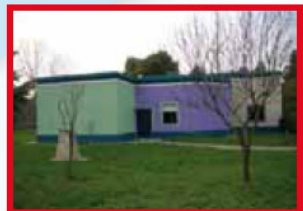
PLESSO VILLAGGIO AZZURRO

Tale organizzazione oraria assicura una compresenza dei docenti di n° 2 ore giornaliere che viene utilizzata per attività in piccoli gruppi e/o di recupero, attività di intersezione, attività di preparazione al pranzo, vigilanza durante la fruizione dello stesso.