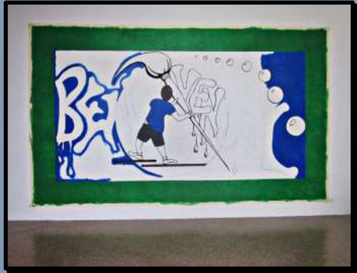
- Fasi di Lavoro -