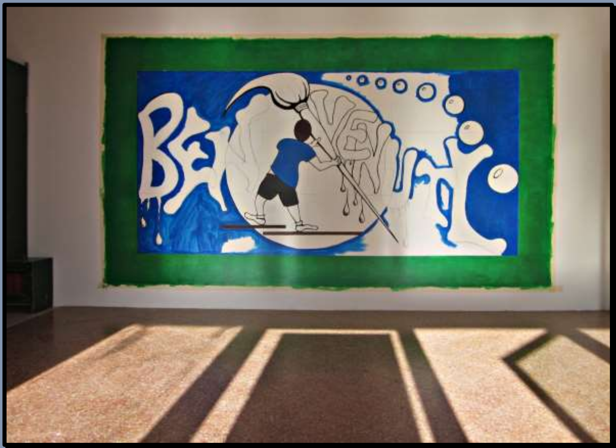
- Il Murales prende Forma -