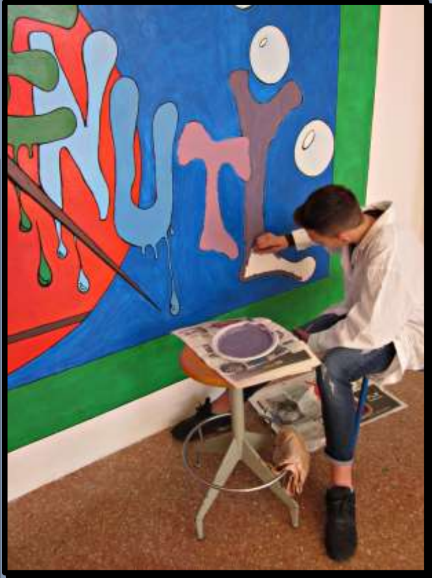
- Ultime Fasi di Lavoro -