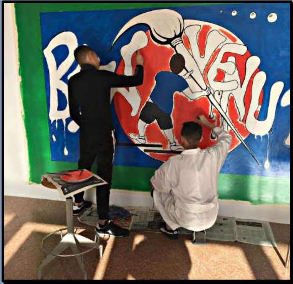
- Allievi a Lavoro -