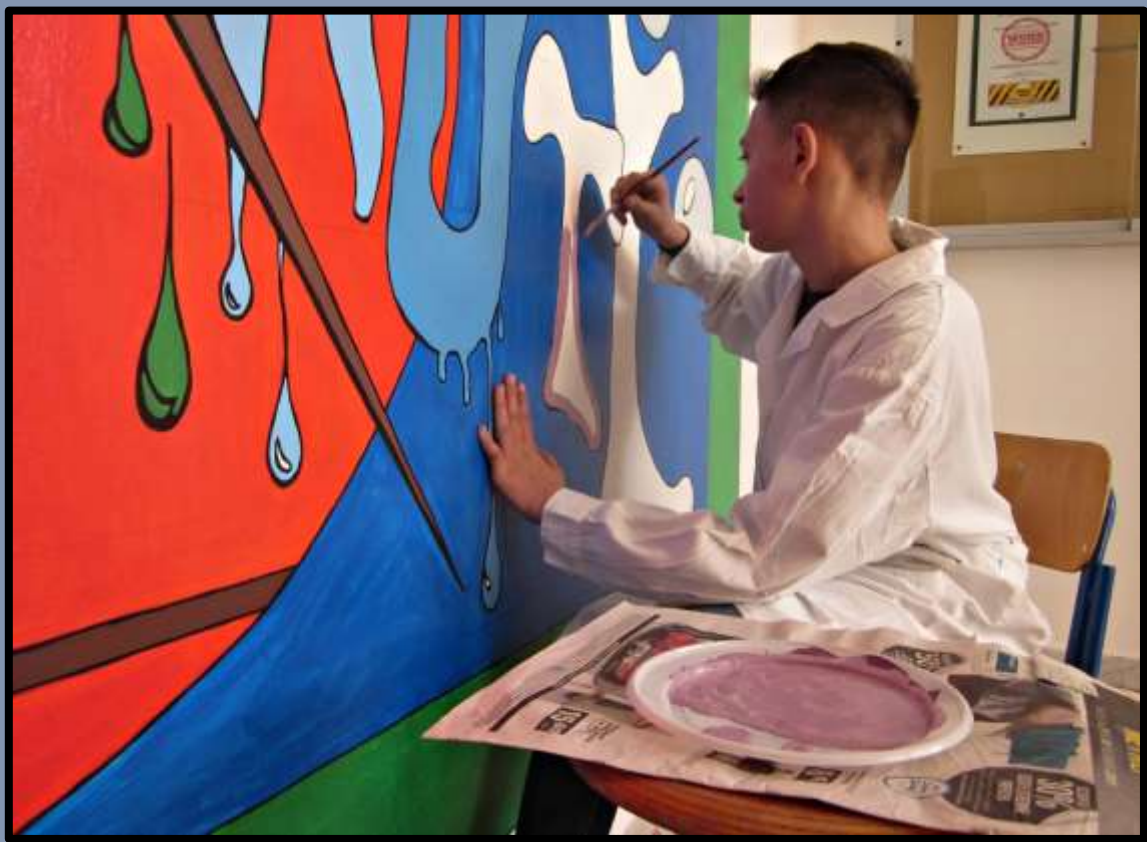
- Ultime Fasi di Lavoro - Aprile/Maggio 2019 -