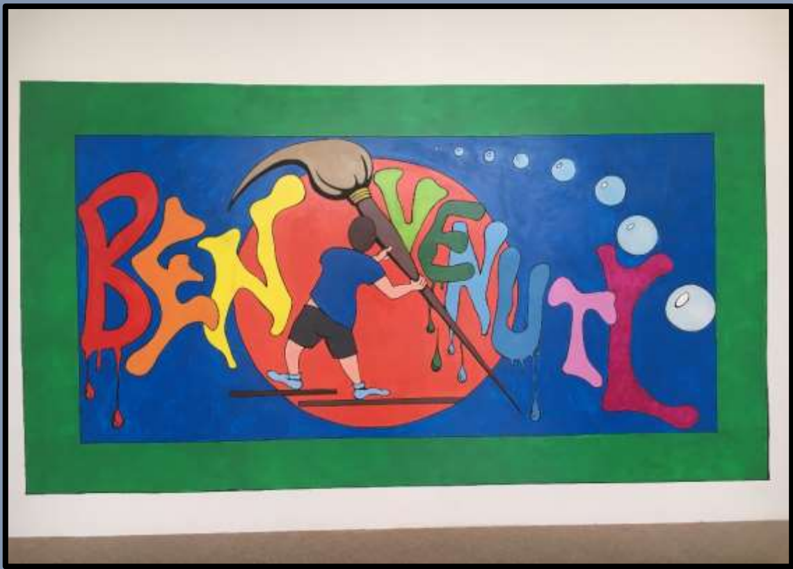
- MuRaLeS ...UlTiMaTo! -