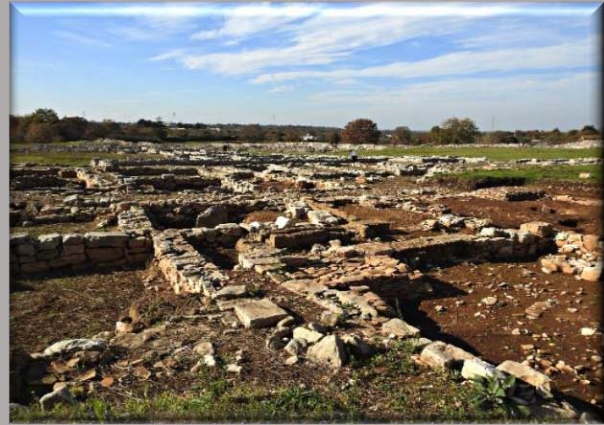
Alcuni scatti fotografici non partecipanti al Concorso eseguiti dalla nostra classe