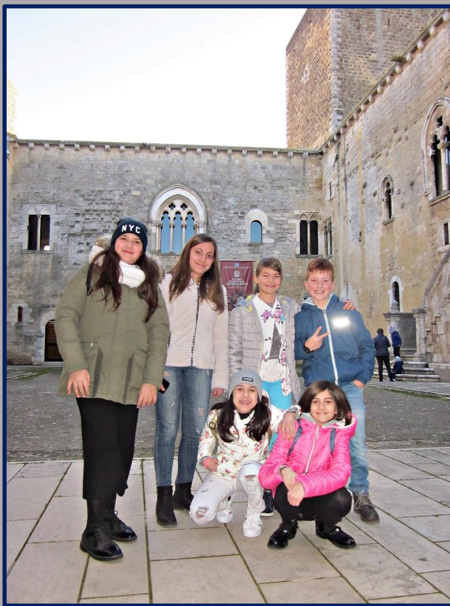
Gruppo intervenuto alla Premiazione ...in rappresentanza della Classe 1^F _Cortile interno del Castello Normanno-Svevo di Gioia del Colle_

I ragazzi partecipanti, appartenenti a 17 classi di diverse scuole della Provincia di Bari, sono stati 370 e a fine gara, la nostra "Roccaforte" a battaglia di like, si è classificata al 10° posto su 17 foto in concorso, ricevendo 418 Like contro i 1644 like della 1^ foto classificata, ma la nostra prof. gratificandoci con un bel 10, ha affermato che per dei ragazzi di 1^ classe di Scuola Secondaria di 1° Grado, alla loro prima esperienza di fotografia 'importante, è stato un OTTIMO risultato!!!